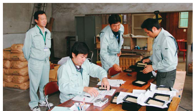
本店 米倉庫の様子

米検査は10月いっぱいまで。JAの今年の集荷量はほぼ平年並み109,200袋を計画しています。