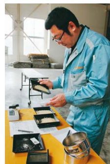
9月26日 六戸地区で初検査

9月26日に六戸支店、10月1日には本店で2013年産米うるち米初検査を行いました。