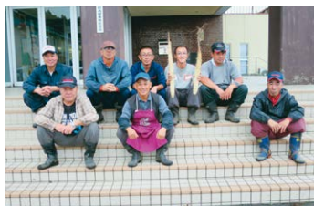
折茂支部のみなさん