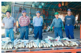
上吉田支部のみなさん