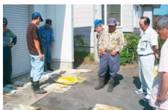
折茂新田支部の共励会のもよう

おいらせ農協やさい推進委員会六戸地区長いも部会は、折茂新田、上吉田、折茂の3支部で坪掘り共励会を行いました。