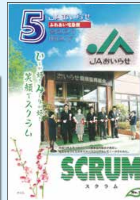
↑2001年4月発行(1号) JAおいらせ オープニングセレモニー